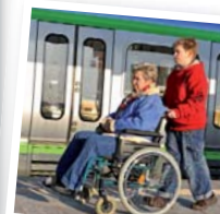
HILFE FÜR BEHINDERTE