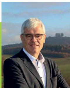
Ihr Bernhard Storath Erster Bürgermeister

Gemeinsam wollen wir „Lebensfreude schenken und Zukunft gestalten“ für einen liebens- und lebenswerten Markt Ebensfeld.